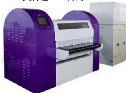
バリ取り機「バートル」